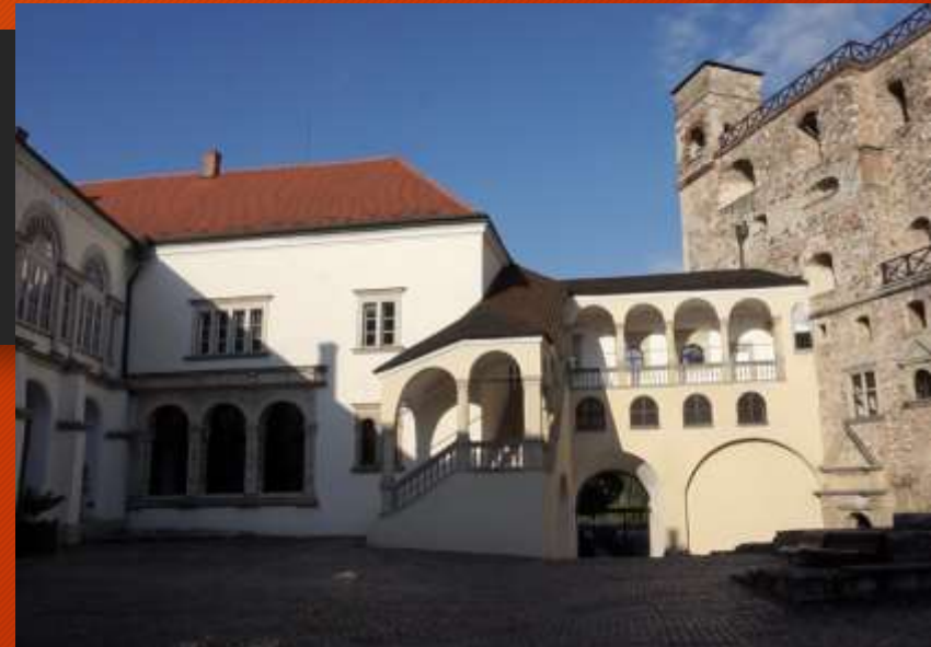
A sárospataki vár reneszánsz része