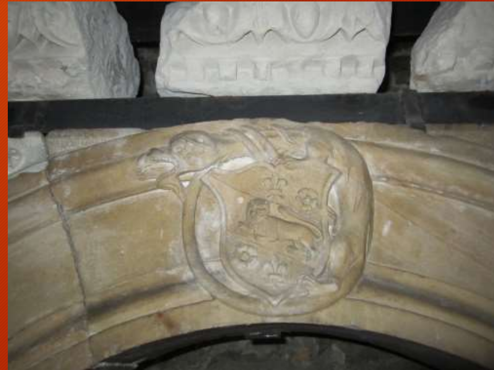
Szatmári címere a palota egykori kapujáról a múzeum Reneszánsz Kőtárában