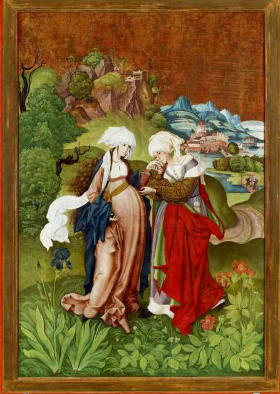
M.S. mester Vizitáció című festménye

Zsigmond király olasz hadvezére, Pipo de Ozora