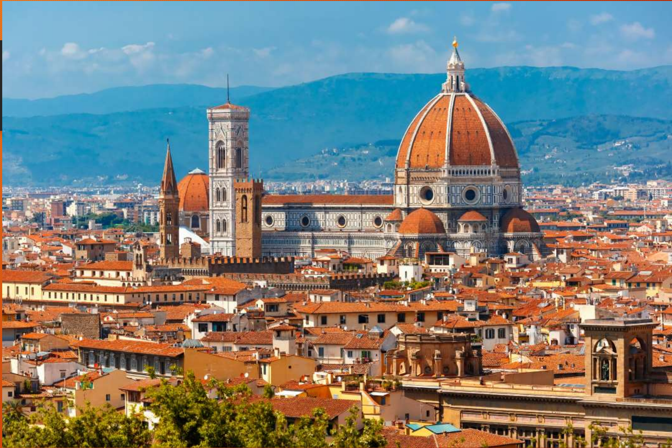
Firenzei dóm (székesegyház)