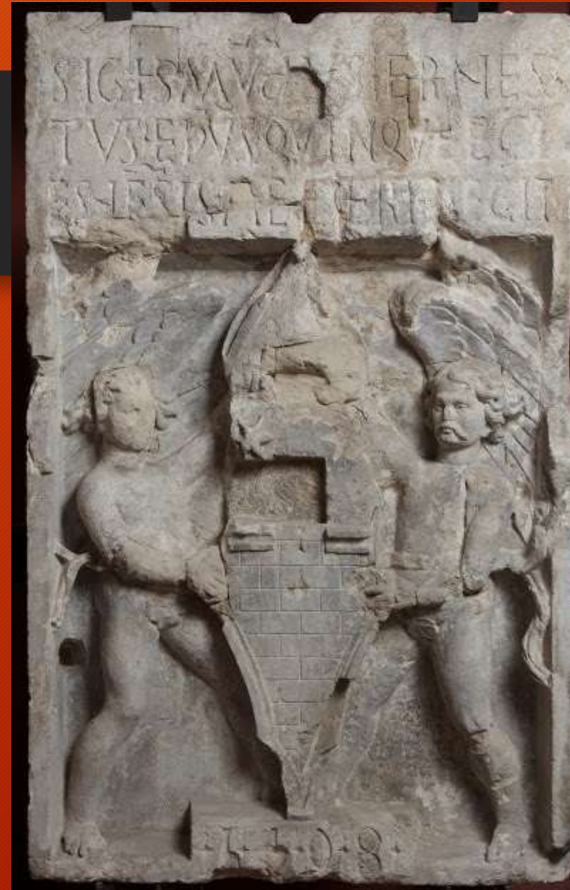
Ernusz Zsigmond címerköve a múzeum Reneszánsz Kötárában