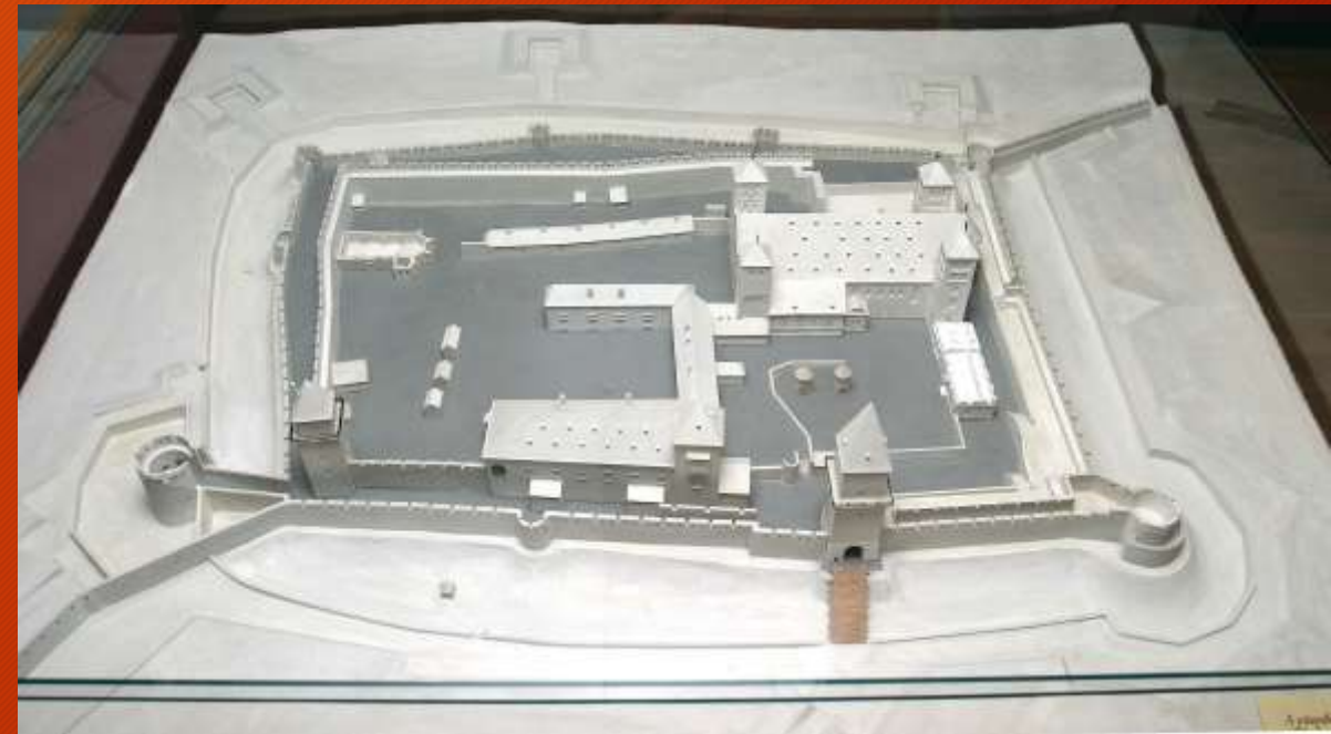
A pécsi püspökvár makettje a Városthörténeti Kiállításban