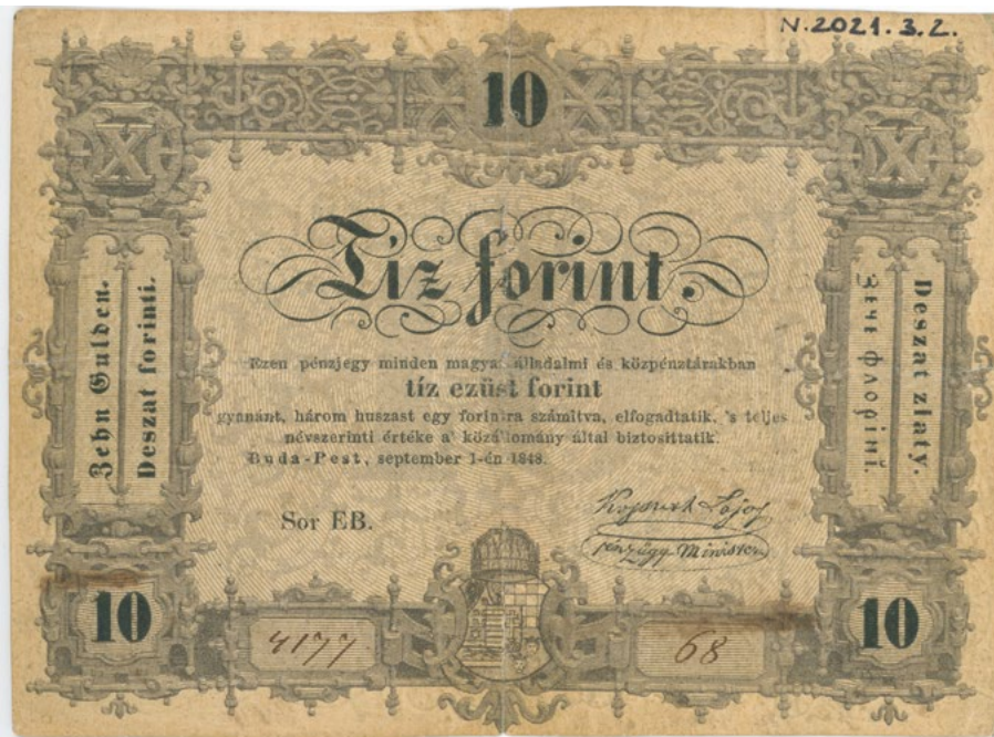
A 10 forintos előoldala (JPM ÚLGYO N. 2021. 3. 2.)