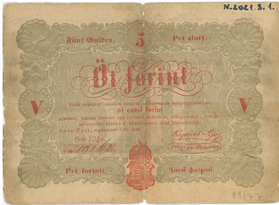
Az 5 forintos előoldala (JPM ÚLGYO N. 2021. 3. 1.)