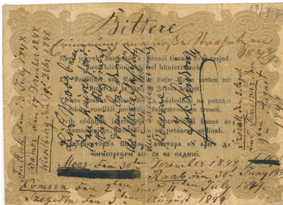
A 10 forintos hátoldala, magyarországi utazásainak állomásainak rögzítésével (JPM ÚLGYO N. 2021. 3. 2.)